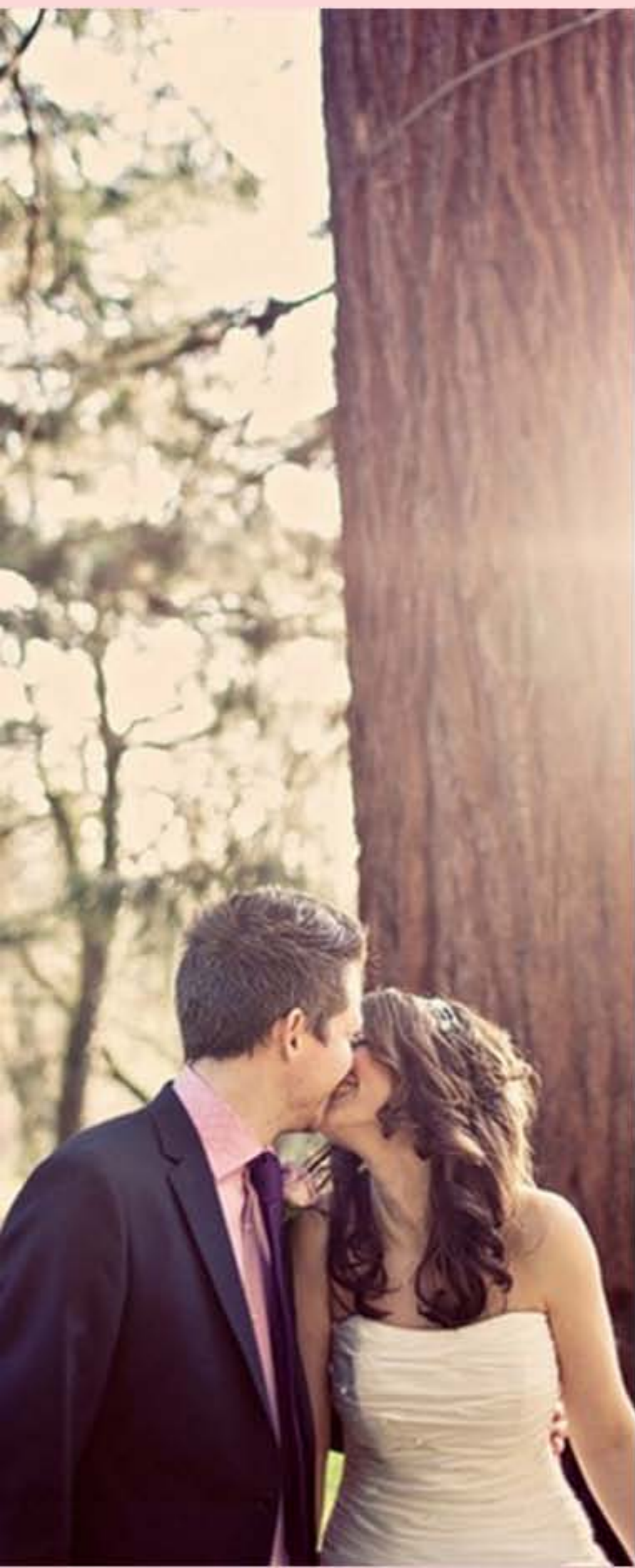
丘比特之甜蜜～ 幹白 Cupido White